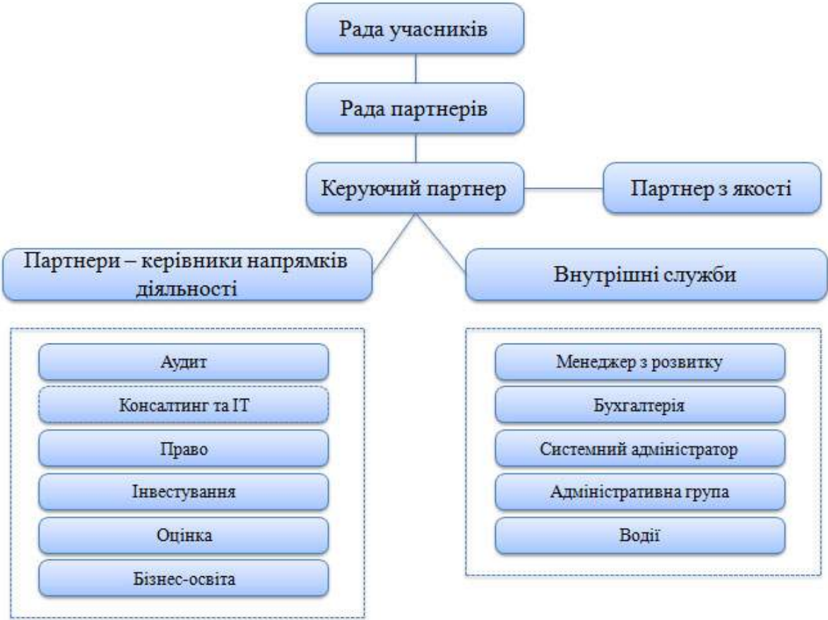
Організаційна структура "Нексія ДК"

за допомогою яких працівники мають можливість надавати пропозиції та спрямовувати діяльність вищого керівництва. Важливим елементом внутрішніх комунікацій є також неформальне спілкування, командні заходи та проекти, у яких беруть активну участь всі керівники та працівники «Нексії ДК». [26]